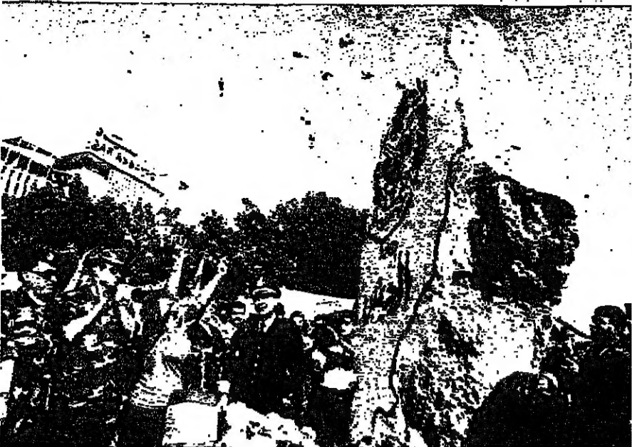
العميد خوري بعد ازالة الستار عن نصب يرمز الى الجيش